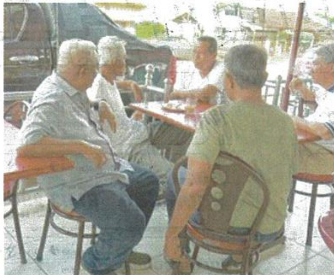
Foto Mohamad merokok di sebuah restoran yang tular di media sosial.

Bantuan Kemanusiaan Malaysia Kepada Palestin di Bawah Inisiatif Kerajaan Hashimiah Jordan, di Putrajaya pada Rabu.